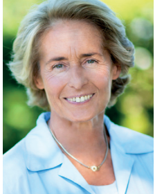
Caroline Cayeux Maire de Beauvais Sénateur de l'Oise