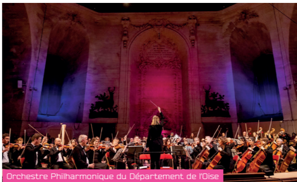
Orchestre Philharmonique du Département de l'Oise

Maladrerie Saint-Lazare, 203 rue de Paris, Beauvais Théâtre du Beauvais - scène nationale, 43 rue Vinot Préfontaine, Beauvais Église Notre Dame de Marissel, 3 Rue Aimé Besnard, Beauvais Communauté de l'Arche, 34 rue du Général Leclerc, Beauvais Auditorium Rostropovitch, Cour de la Musique, rue de Gesvres, Beauvais Hôtel du Département, 1 Rue Cambry, Beauvais C.A.U.E de l'Oise, 4 rue de l'Abbé du Bos, Beauvais Salle des fêtes, Place Théron, Saint-Just-en-Chaussée