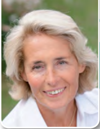
Caroline CAYEUX Maire de Beauvais Sénateur de l'Oise